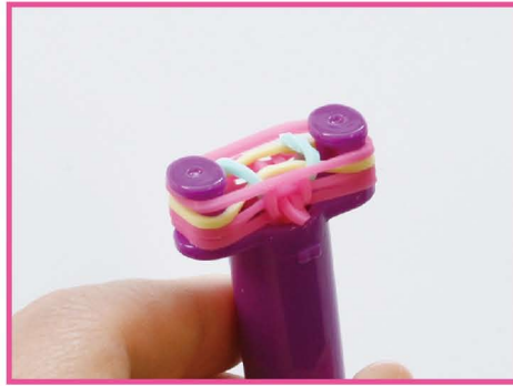
11 つぎ 次は、ネオンピンクのバンドを かけ かけます。