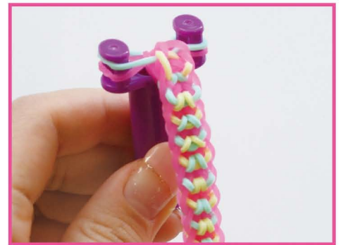
17 なが もっと ばあい 長くしたい場合は、バンドの ほんすう 本数を ふ 増やして あ 編んでください。