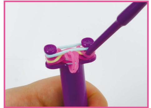
15 うへ 上から ばんめ 2番目の うちがわ ネオンピンクの した バンドの内側から、すぐ下にある はず パステルイエローのバンドを外して、 まなか 真ん中へ