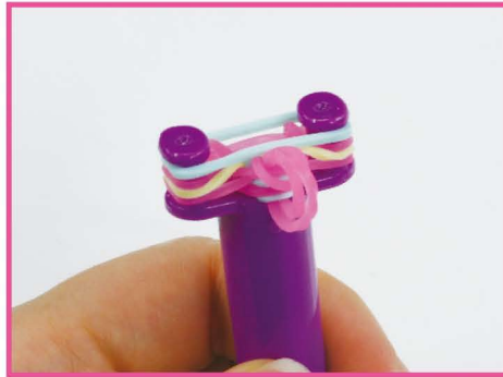
14 つぎ 次は、パステルグリーン の バンド を かけます。