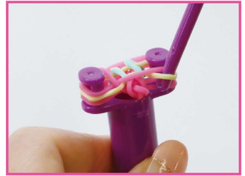
12 うへ 上から ばんめ 2番目の うちがわ パステルイエローの いちばんした バンドの内側から、一番下にある はず ネオンピンクのバンドを外して まなか 真ん中へ