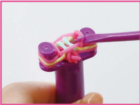
13 かたがわ 片側も おな 12 と同じように はず 外します。