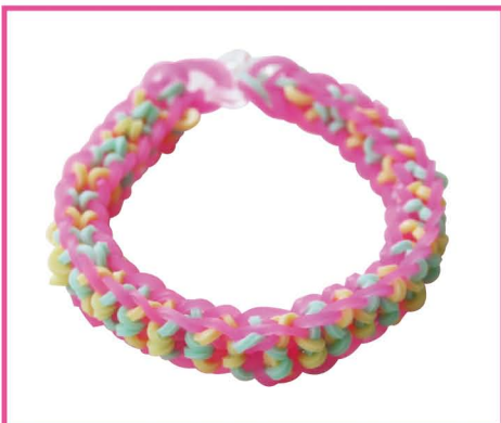
18 ほんたい 本体から はず 外して りょうはし 両端の かんせい バンドを とめて クリップで しゅつ 完成です。