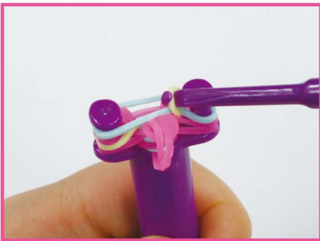
16 かたがわ 片側も おな 15 と同じように はず 外します。