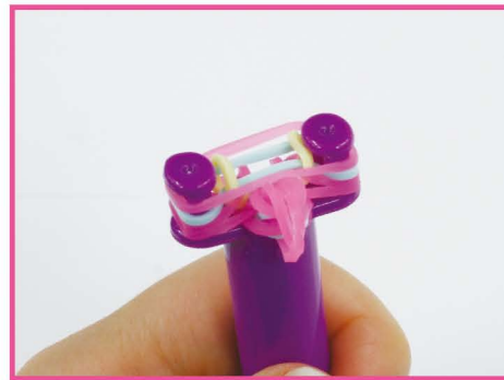
16 つぎ 次は、ネオンピンクのバンドを かけ かけ、5~16 てしゅん の手順をくりかえ し します。