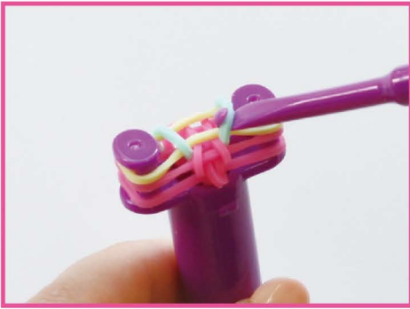
10 かたがわ 片側も おな 9 と同じように はず 外します。