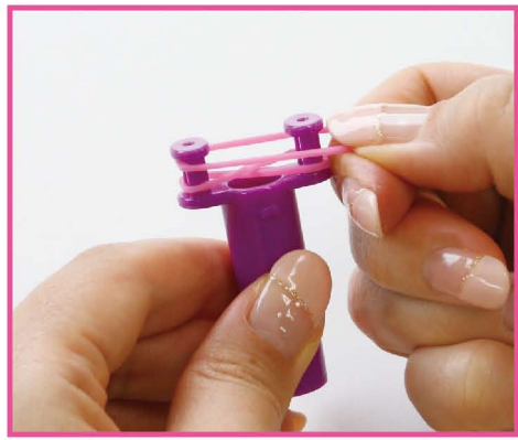
2 その上にピンクのバンドをかけます。