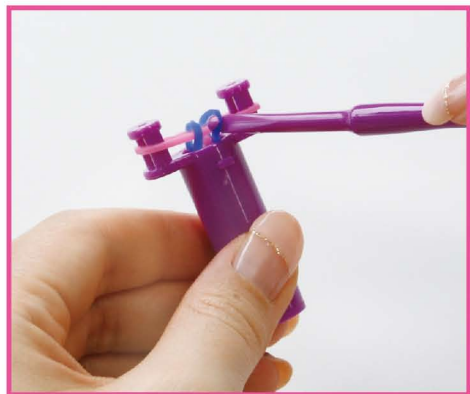
7 同じ手順を繰り返し、ピンク→ピンク→ピンク→ネオンパープル→ピンク→ピンク→ピンク→青と編んでいきます。