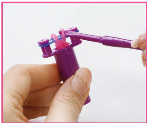
6 一番下のピンクのバンドを3と同じようにピンから外して真ん中へ。