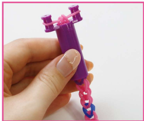
8 もっと長くしたい場合は、バンドの本数を増やして編んでください。