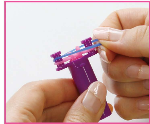
5 次は、青のバンドをかけます。