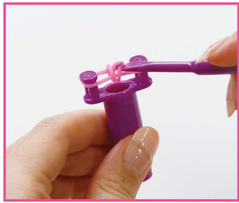
3 一番下のピンクのバンドを左右それぞれ外側から引きだし、ピンから外して、真ん中へ。