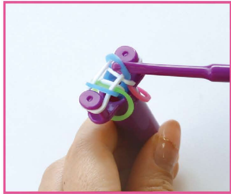
9 一番下のパステルブルーのバンドを左右それぞれ外側から引き出しピンから外して、真ん中へ。