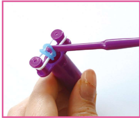
3 一番下のパステルブルーのバンドを左右それぞれ外側から引き出しピンから外して、真ん中へ。