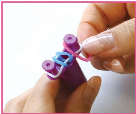
4 次は、ピンクのバンドを右側のピンにかけます。