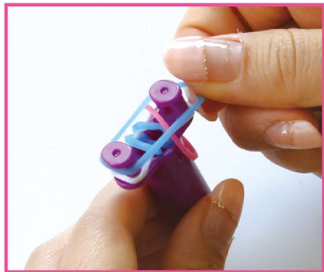
5 その上にパステルブルーのバンドをかけます。