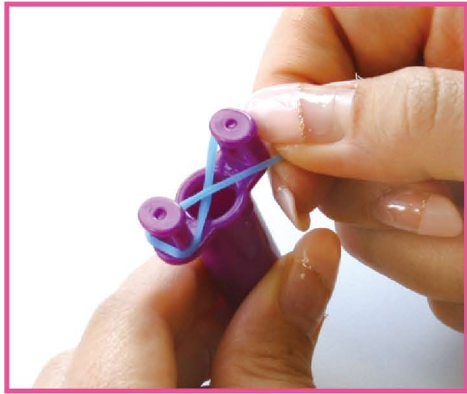
1 本体の先端にパステルブルーのバンドを8の字にねじってピンにかけます。

※この「つくりかた説明」では、パープルの本体とフックを使用しております。予めご了承ください。