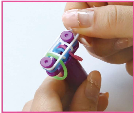
8 その上に白のバンドをかけます。