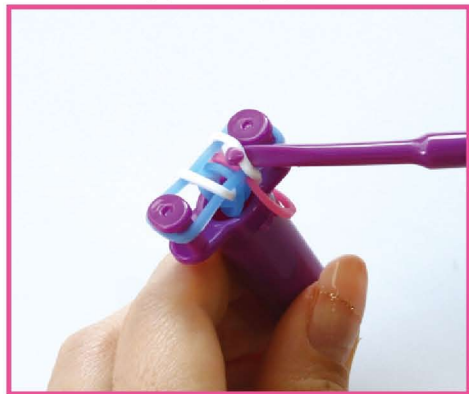
6 一番下の白のバンドを左右それぞれ外側から引き出します。ピンから外して、真ん中へ。