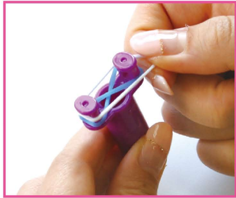
2 その上に白のバンドをかけます。